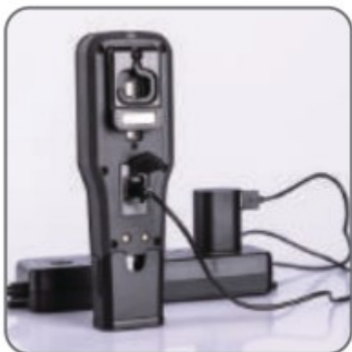
Nabíjení ze sítě