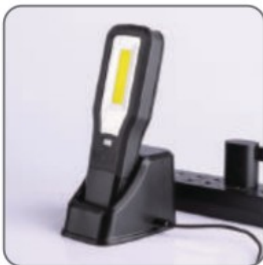
Nabíjení ze základny